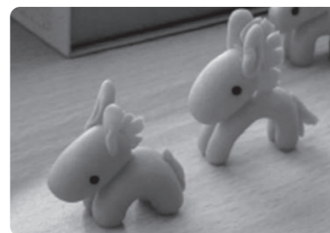
▲認知症サポーターのシンボル「ロバ隊長」

今後も一人ひとりが地域の中で役割を持ち、いきいきと活躍できる機会や、居場所づくりを進めてまいります。