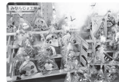
▲展示・販売ブースの様子