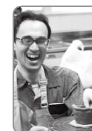
▲やきもの教室 (福祉センター)