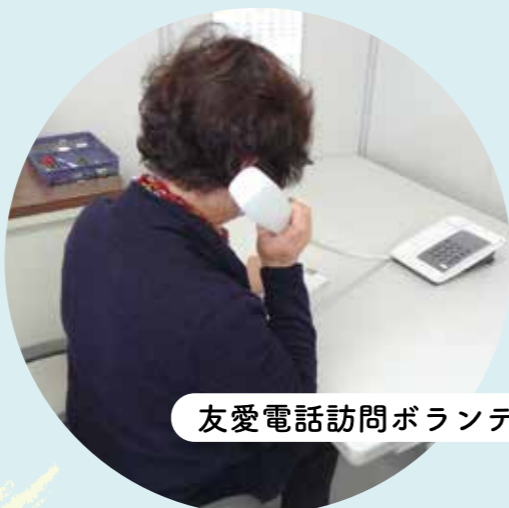
友愛電話訪問ボランティア

熱中症や感染症への心配や不安から、今まで参加していた体操教室やサロンなどに行くことを控えて活動の量が減っていませんか。 散歩やストレッチに加えて、人と関わることはフレイル（介護状態の前段階）予防に欠かせません。直接会えなくても、電話でお話することも効果的です。