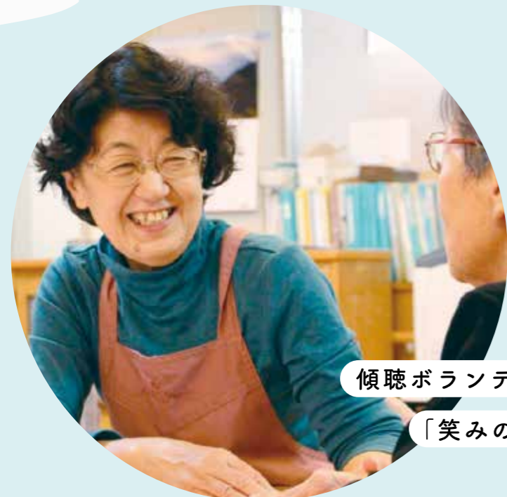
傾聴ボランティア