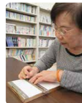
▲点字を打っている様子

集まって点訳をするだけでなく、皆と楽しく談笑できる雰囲気の良い「なかま」の魅力です。このメンバーと可能な限り長く活動を続けていきたいと考えています。