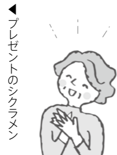
▲プレゼントのシクラメン

毎年、民生委員の活動として、各地域で年末に一人暮らしの高齢のかたへプレゼントをお渡ししています。地域ごとにプレゼントの内容は異なりますが、どの地域でも、訪問先の笑顔は民生委員の力になっています。