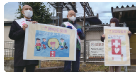
▲市内3ヶ所で実施（街頭啓発）