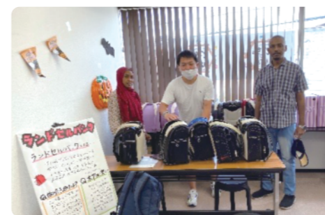
9月に行われた譲渡会のようす

「こども文房具ポスト」に寄付していただいた学校用品や「ランドセルバンク」による手入れされたランドセルの無償譲渡会をおこないます。